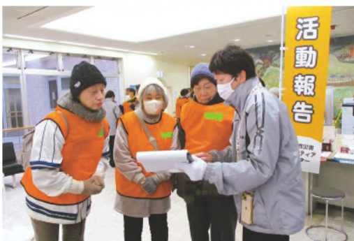
▲グルーピング(相談内容共有)