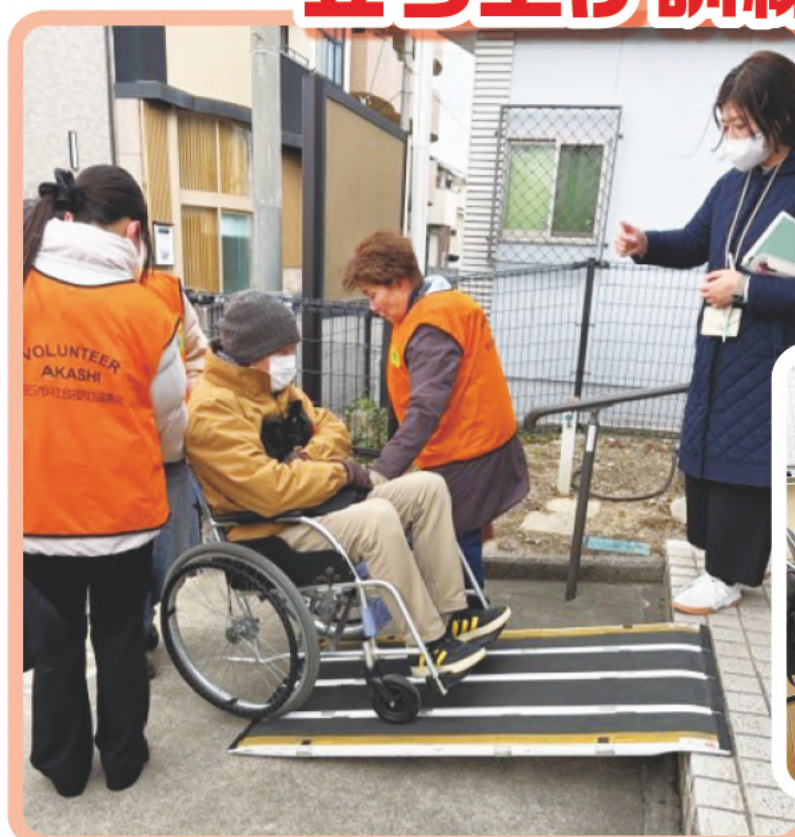
▲災害時の移動支援（活動中の様子）