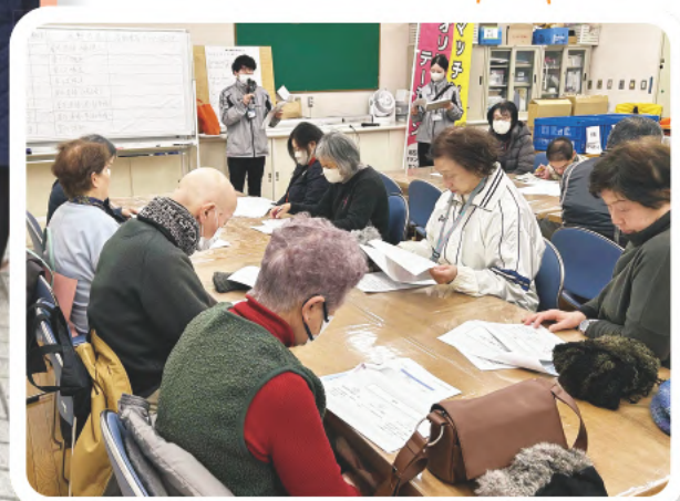
▲訓練の意義や内容の説明（オリエンテーション）