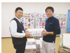
エコイト神戸学が丘店 (右)より