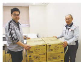
川崎重工業株式会社 明石工場 様(右)より