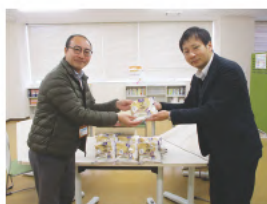
生活協同組合コープこうべ 第6地区本部 様(右)より